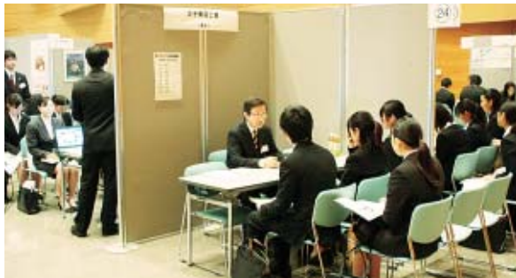
人事担当者の説明に熱心に耳を傾ける学生

説明会開催前には、事前講演として「就活ノウハウセミナー」が行われ、参加した学生は、現在の企業が求めている人材や、エントリーシート の書き方などの話 に熱心に聞き入っ