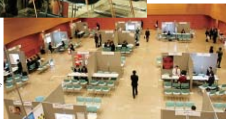
企業ブースがセッティングされた会場=アエル5階、多目的ホール