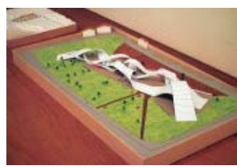
老人福祉施設と児童福祉施設をつないだ空間デザイン