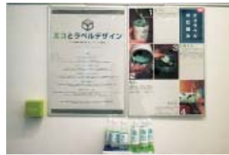
人と環境をつなげるペットボトルの情報デザイン